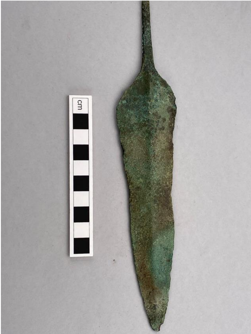
Bronsdolk från röset L 1956-3785. Den är daterad till 1300 – 600 f. Kr.

2 Att de enda kända fornminnena på Skäggenäs är just från bronsåldern. De stora rösen är typiska bronsåldersrösen, och man har ju också hittat några enstaka föremål där, just från denna tid. Det måste ha funnits ganska gott om folk för att bygga rösen, och då bör de ju ha bott relativt nära.